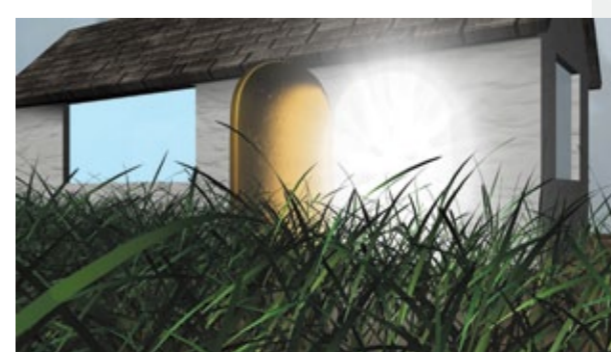
Lily Benson, A TOUR OF THE SELF CLEANING HOUSE, 2014