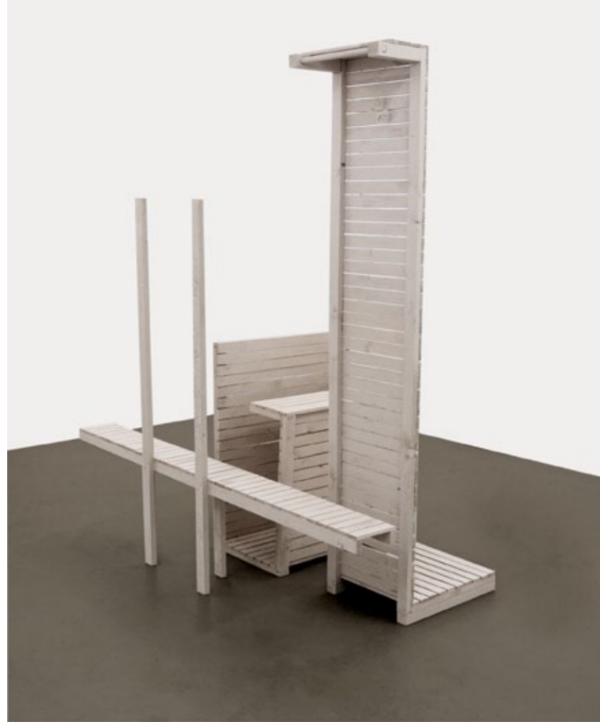
Ingrid Furre, O (artoteksmöbler), 2015